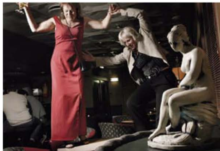
OPP FRA STOLENE: Rødkjole og Hvitjakke viser at livet er en fest. Uansett alder.