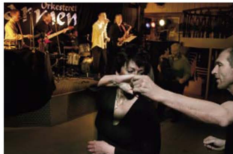
FOLKA PÅ GØLVE: Med danseband skal ensomheten bekjempes.

– Nå skal vi spille vårt bidrag til Årets Dansebandmelodi 2002, skryter vokalist, uten at noen fatter at det han egentlig sier er at de ikke vant.