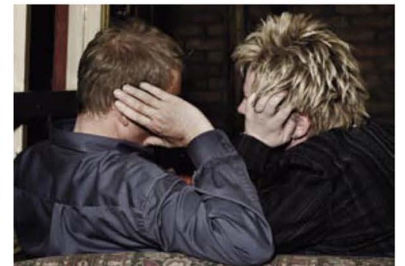
HEMMELIGE ORD: I utestedets kroker og krokar ligger mange hemmeligheter gjemt. Eller vises helt åpenlyst.

– Få se tissen din, da, spør kvinnen ganske så direkte.