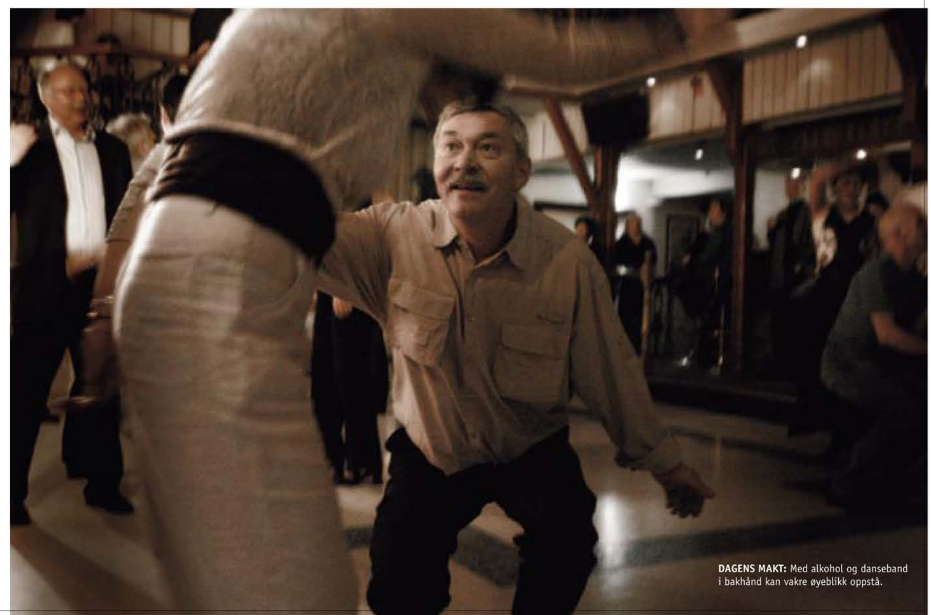
DAGENS MAK: Med alkohol og danseband i bakhånd kan vakre øyeblikk oppstå.

En bedugget journalist og hans fotograf forlater lokalet, enige om at kvelden har vært helt konge. Jeg tror kanskje jeg loy til kvinnen. Det er mulig jeg dukker opp igjen for det har gått tyve år. Og det tør jeg innrømme i ti tusen eksemplarer. UD