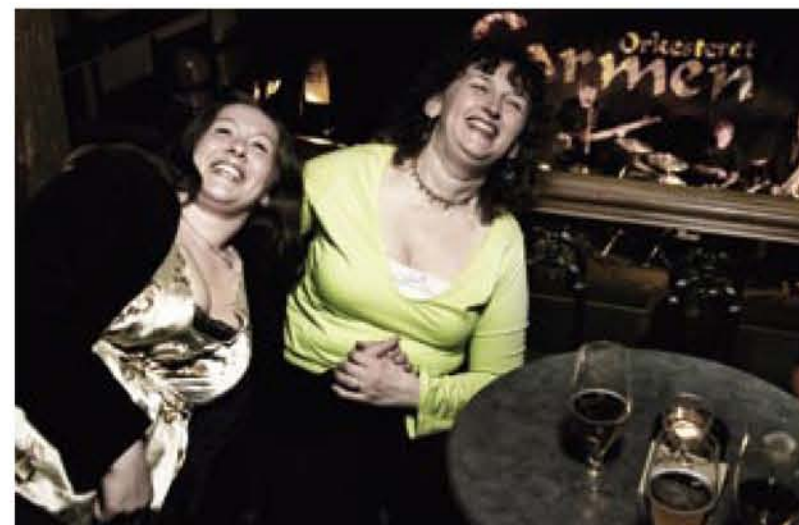
KVINNENE BAK BANDET: Ektemennene liker ikke å høre på sin egen musikk, kan deres fruere avsløre. Men lettjente penger er det.